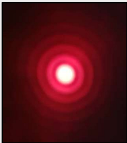
طرح پراش روزنه ریز دقیق ۲۴ میکرون ساخت شرکت، که با لیزر هلیوم-نئون روشن شده است.

شرکت دانش بنیان فتح نور میهن با در اختیار داشتن تجهیزات پیشرفته و انجام آزمون های مورد نیاز، کیفیت تولیدات خود را تضمین می کند.