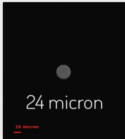
تصویر گرفته شده از روزنه ریز دقیق ۲۴ میکرون ساخت شرکت، توسط میکروسکوپ Olympus IX70 با عدسی شیئی X ۲۰.

« محصولات مرتبط: پالایه فضایی، جابجاگر خطی دستی یک بعدی، انبرک نوری