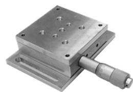
جابجاگر خطی دستی سه بعدی مینیاتوری